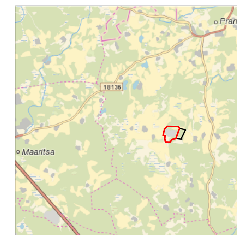
Kaardileht nr 5423 Kanepi